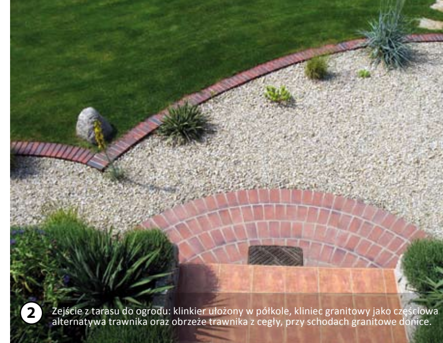
2 Zejście z tarasu do ogrodu: klinkier ułożony w półkole, kliniec granitowy jako częściowa alternatywa trawnika oraz obrzeże trawnika z cegły, przy schodach granitowe donice.

Inwestorzy od razu zaznaczyli, że wszelkie prace ziemne związane z roślinnością, wykonają sami. Kontakt z przyrodą to dla nich wymarzona chwila relaksu po tygodniu ciężkiej pracy. Po kilku wskazówkach zabrali się do robót. ▷