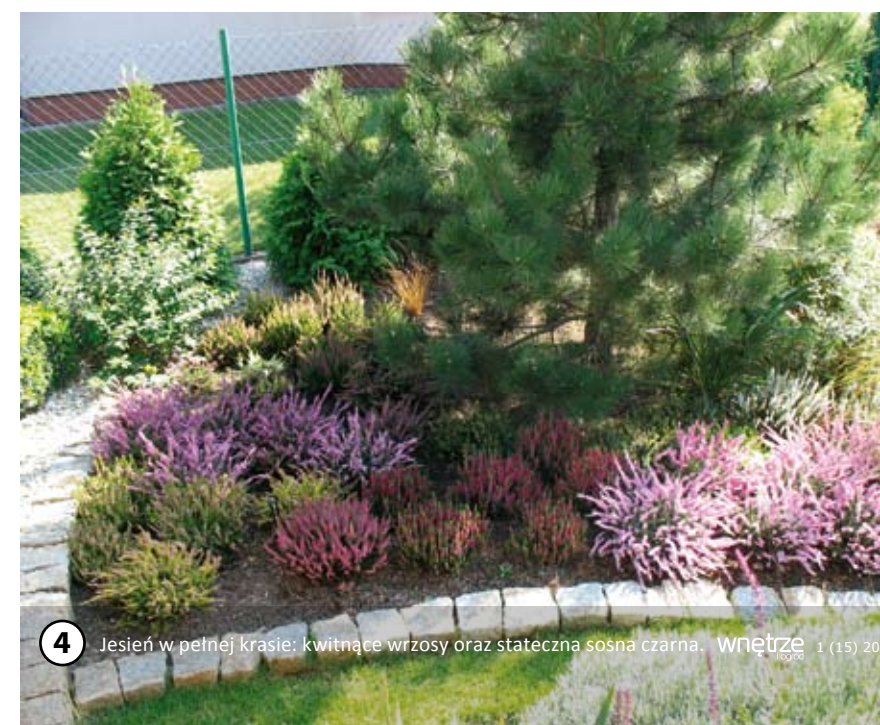
4 Jesień w pełnej krasie: kwitnące wrzose oraz stępcza sosna czarna. wnetrze 1 (15) 2009