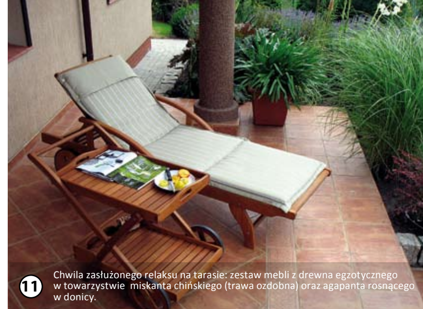
11 Chwila zasłużonego relaksu na tarasie: zestaw mebli z drewna egzotycznego w towarzystwie miskanta chińskiego (trawa ozdobna) oraz agapanta rosnącego w donicy.

Aby osiągnąć zaplanowany efekt, trzeba było mnóstwa wyrzeczeń, ciężkiej pracy także w weekendy. Ale chyba było warto – oceńcie Państwo sami. Ogród po kapital- nym „remontie” – otrzymał drugie, zasłu- żone życie. Odpowiedni projekt to tylko połowa sukcesu... □