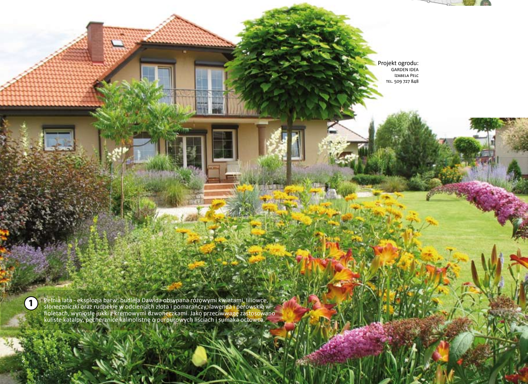
1 Pełnia lata - eksplozja barw: budleja Dawida obsypana różowymi kwiatami, liliowce, słoneczniczki oraz rudbekie w odcieniach złota i pomarańczy, lawenda i perowskie w fioletach, wyniosłe jukki z kremowymi dzwoneczkami. Jako przeciwagę zastosowano kuliste katalpy, pęcherznice kalinolistne o purpurowych liściach i sumaka octowca.