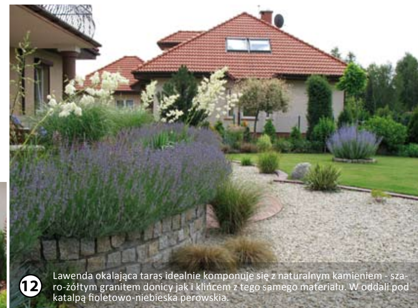
12 Lawenda okalająca taras idealnie komponuje się z naturalnym kamieniem - szaro-żółtym granitem donicy jak i klincem z tego samego materiału. W oddali pod katalpą fioletowo-niebieska perowskia.