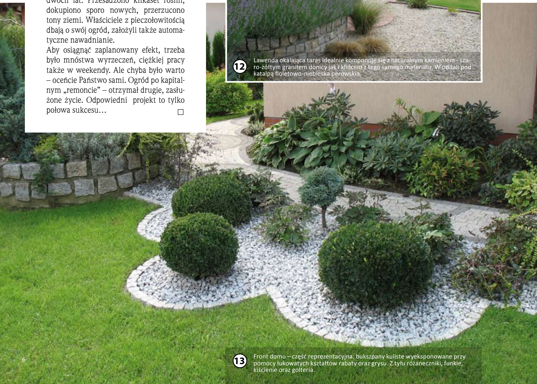
13 Front domu – część reprezentacyjna: bukszpany kuliste wyeksponowane przy pomocy łukowatych kształtów rabaty oraz grysu. Z tyłu różaneczniki, funkje, kiścieńce oraz golteria.